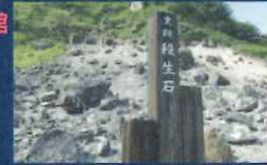
殺生石。栃木県指定文化財で、九尾の狐伝説にまつわる。那須を代表する史跡の一つです。