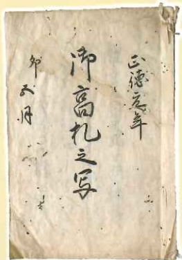
御高札之写 正徳元(1711)年 当館蔵