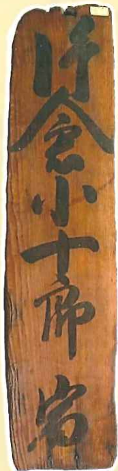
片倉小十郎宿札 個人蔵

これら「高札」は当時の時代背景を映した鏡です。今回の展示では、町指定文化財である「高札」が勢ぞろいするだけでなく、芦野にある文化財も紹介いたします。「高札」から江戸時代・幕末の芦野にタイムスリップしましょう。